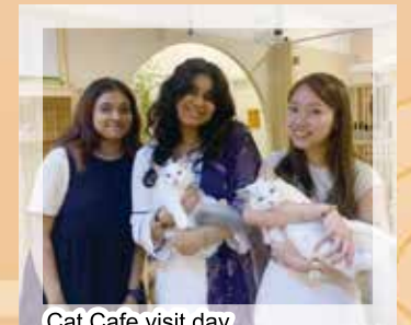
Cat Cafe visit day