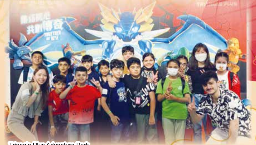
Triangle Plus Adventure Park