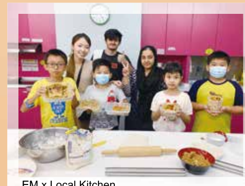
EM x Local Kitchen