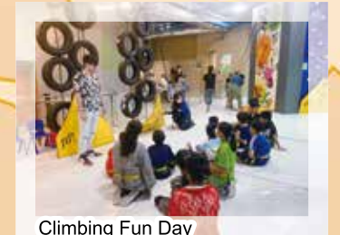
Climbing Fun Day