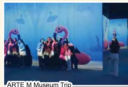
ARTE M Museum Trip