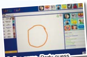
Online game- Party guess