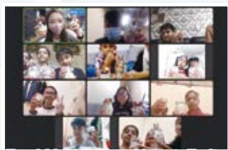
Food Making Day- Yogurt, Fruit & Oats Breakfast Pots