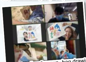
Happy Handicraft group- bag drawing