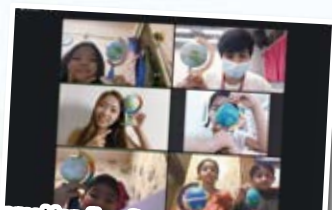
Happy Handicraft group- Globe making